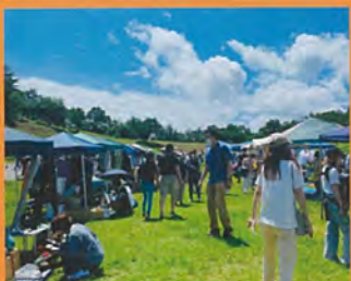
上越の地域資源を最大限活用して楽しむ 親子イベントの開催