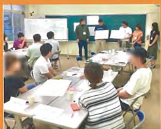
「上越若者みらい会議」設立 若者の地域参画を応援