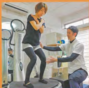
病気になる食生活と運動の提案「ロハス」