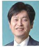
県議会議員 牧田まさき