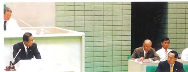
■四代市長 木浦正幸氏に質問(平成13年~平成21年)