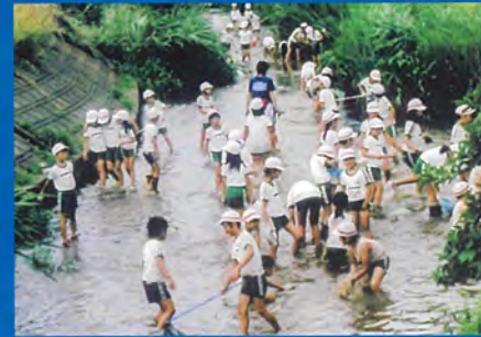
高田地区のシンボル青田川の環境保全活動などの先頭で