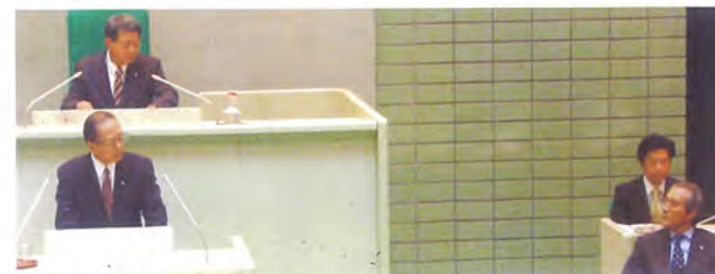
■五代市長 村山秀幸氏に質問(平成21年~平成28年)