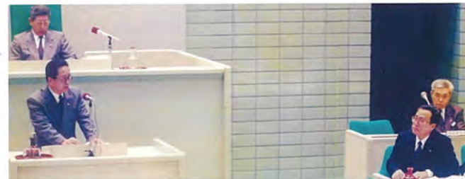
■三代市長 宮越 馨氏に質問(平成5年~平成13年)