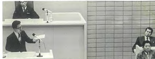
■二代市長 植木 公氏に質問(昭和49年~平成5年)