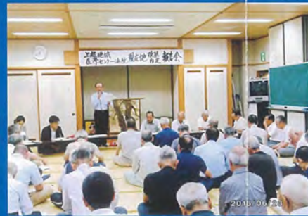
上越地域医療センター病院の早期建設や医療体制の充実を