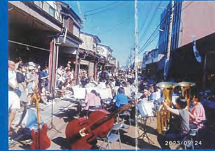
雁木の保存や三世代交流活動の促進で地域の元気づくりを