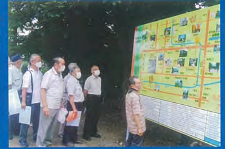
地域の歴史文化を活かして住民の住みやすいまちづくりを